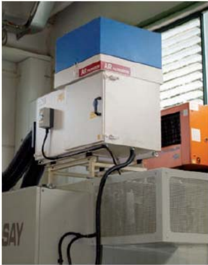
Detail eines Luftreinigers von AR, Baureihe ARNO, angebracht auf einer automatischen Drehmaschine.

Luftreiniger Baureihe ARNO mit Vorkammer: In dieser Vorkammer erfolgt die Vor-Abscheidung am Einlass, wodurch die gesamte Leistungsfähigkeit der Filterung erhöht wird. Diese Vorkammer wird bei besonders schweren Einsatzbedingungen verwendet.