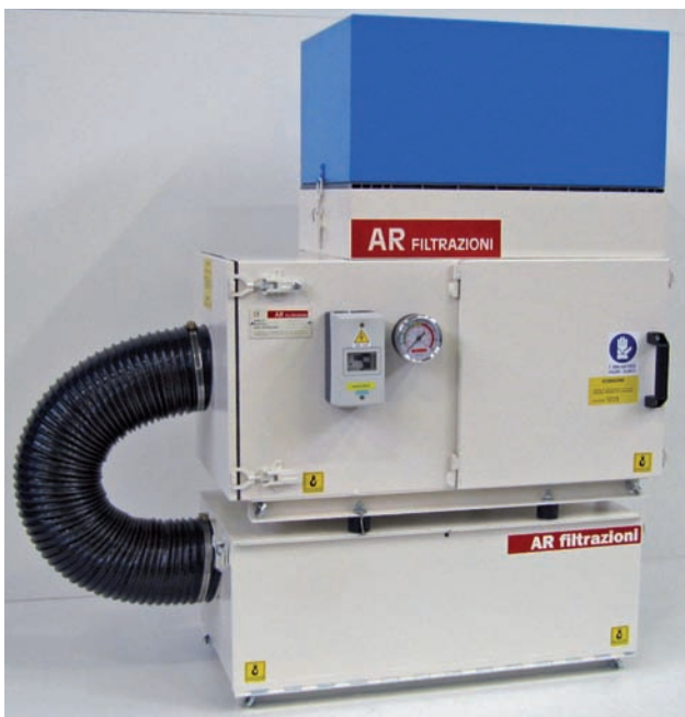
Depuratore serie Arno con precamera: quest'ultima effettua un pre-abbattimento all'entrata aumentando l'efficienza globale della filtrazione; viene utilizzata in condizioni di lavoro particolarmente gravose.

ultime si depositano sulle pareti lungo le quali scorrono raccogliendosi in basso dove vengono ricondotte nel serbatoio della macchina. L'aria attraversa un filtro metallico e poi in un secondo stadio di filtrazione dove le vengono sottratte le impurità residue. Per una filtrazione ancora più spinta, l'aria viene fatta passare in un ulteriore terzo stadio dopo il quale viene restituita all'ambiente con purezza "assoluta" (a norme EN 1822) ossia con un residuo di impurità inferiore al livello di rilevabilità.