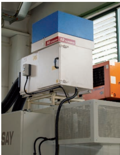
Dettaglio di un depuratore AR serie Arno installato su un tornio automatico.

ultime si depositano sulle pareti lungo le quali scorrono raccogliendosi in basso dove vengono ricondotte nel serbatoio della macchina. L'aria attraversa un filtro metallico e poi in un secondo stadio di filtrazione dove le vengono sottratte le impurità residue. Per una filtrazione ancora più spinta, l'aria viene fatta passare in un ulteriore terzo stadio dopo il quale viene restituita all'ambiente con purezza "assoluta" (a norme EN 1822) ossia con un residuo di impurità inferiore al livello di rilevabilità.