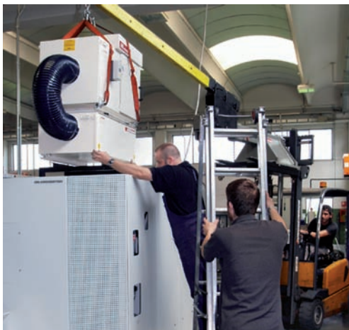
Fase d'installazione di un nuovo impianto AR su una macchina utensile nell'officina OMZ.

filtri tradizionali, sarebbe necessario sostituire il gruppo filtro. Col sistema AR – grazie alla sua modularità – il depuratore è invece modificabile a piacere: esso può così “crescere” con la macchina ed essere progressivamente adattato a diverse produzioni restando sempre perfettamente adatto ed efficiente.