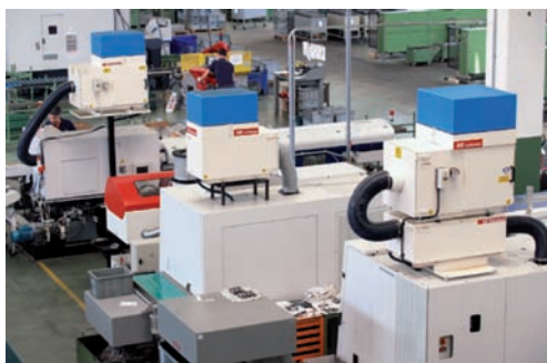
Un altro aspetto dell'officina OMZ: si notano i depuratori d'aria AR Filtrazioni. Nebbie e fumi sono completamente scomparsi.

più seri quanto più intensive e pesanti sono le lavorazioni. Alla OMZ, come detto, si persegue la massima produttività e si lavora quindi con i parametri (velocità di taglio, profondità di passata e avanzamenti) più elevati. Accade così che le macchine sviluppino grandi quantità di fumi molto sgradevoli ma anche pericolosi per il personale. La naturale ventilazione degli ambienti – anche d'estate e anche a porte e finestre aperte – non è assolutamente sufficiente ad assicurare un'atmosfera pulita.