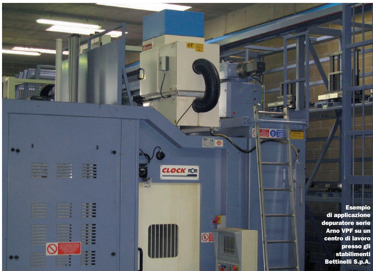
Esempio di applicazione depuratore serie Arno VPF su un centro di lavoro presso gli stabilimenti Bettinelli S.p.A.

T utelare la salute e la sicurezza all'interno delle aziende manifatturiere è un aspetto di grande importanza. L'adempimento alle norme igienico-ambientali vigenti risulta indispensabile, non solo per mantenere un'elevata competitività nel settore operativo ma anche per l'ottenimento di eventuali certificazioni di qualità. È dello stesso parere anche CDS – Cam Driven Systems, divisione della Bettinelli F.lli S.p.A. di Bagnolo Cremasco (CR), che si occupa della progettazione e costruzione di sistemi a camma per attuatori di movimenti complessi, ovvero rotanti, lineari, oscil-