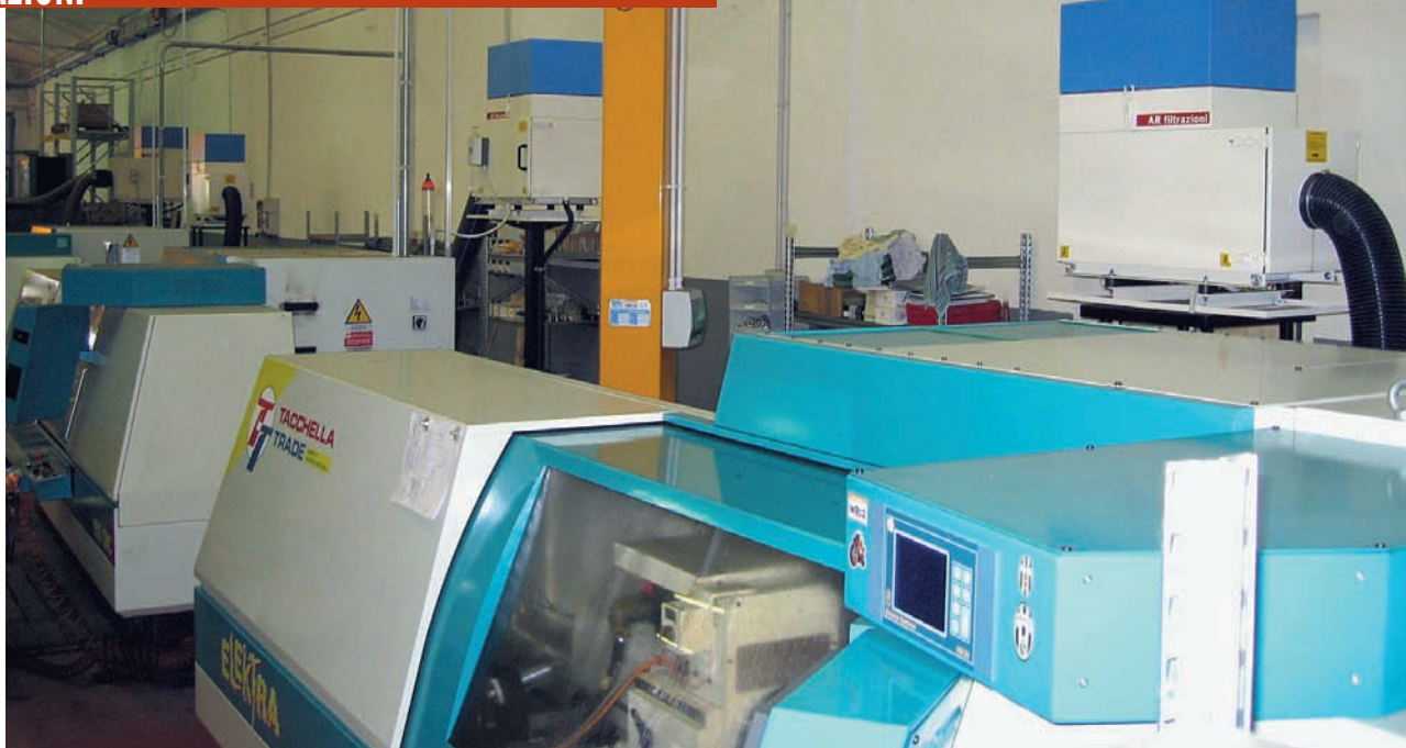
I depuratori appartenenti alla gamma Arno VF sono indicati per l'aspirazione e la depurazione di nebbie d'olio e polveri generate nelle lavorazioni a secco e a umido. Qui un esempio di installazione su macchine rettificatrici.