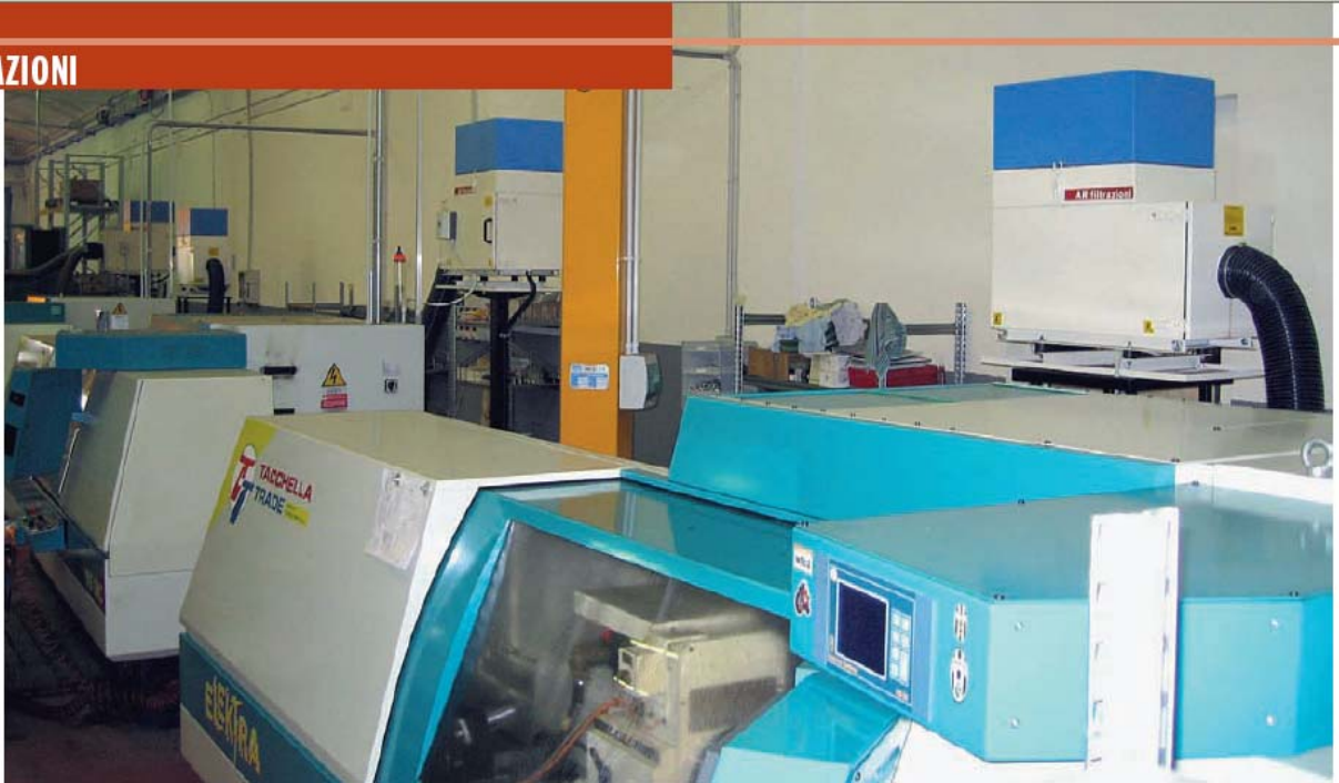
Die Luftreiniger der Baureihe "Arno VF" eignen sich für die Absaugung und Reinigung von Ölnebeln und Staub, die bei Nass- und Trockenbearbeitungsverfahren entstehen. Hier ein Beispiel für die Anbringung an einer Schleifmaschine.