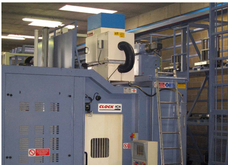
Beispiel für die Anwendung eines Serien-Luftreinigers "Arno VPF" in einem Produktionsbetrieb des Unternehmens Bettinelli S.p.A.