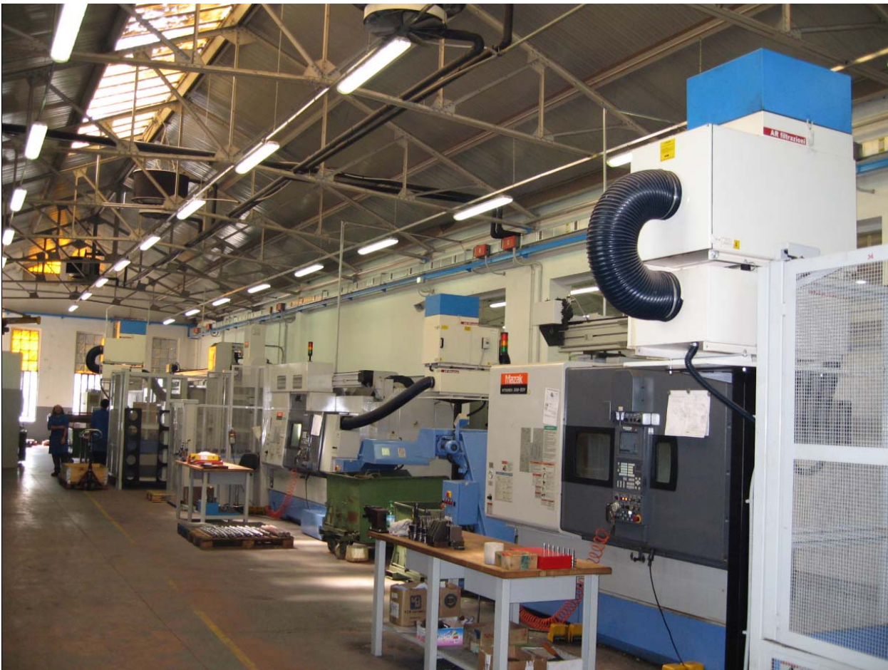
Unter schweren Einsatzbedingungen können die Luftreiniger "Arno VPF" mit einer Abscheidungs-Vorkammer ausgestattet werden.

man hat vollständig klimatisierte Bereiche und somit ideale Bedingungen für die Herstellung eines dementsprechend hochwertigen Endproduktes. „In diesem Zusammenhang“, fährt Chiozzi fort, „wurde die Optimierung der Luftreinigung in den Fabriken zu einer unumgänglichen Forderung, die wir an unsere Produktion und an unser Arbeitsumfeld gestellt haben. Wir haben versucht, die oben geschilderten Probleme zu lösen, in dem wir uns auf dem Markt kundig gemacht und unsere genauen Forderungen dargelegt haben. So haben wir uns schließlich an AR Filtrazioni gewandt. Dabei haben wir zuerst deren Produkttypologie getestet und anschließend die Zusammenarbeit ausgeweitet. Dieses Unternehmen war tatsächlich in der Lage, uns nicht nur eine hohe Produktqualität zu gewährleisten, sondern auch einen umfassenden, leistungsfähigen Service zuzusichern, wodurch es uns von all dem entlastet hat, was im Zusammenhang mit Luftqualität und Luftreinigung in unseren Werken steht. In anderen Worten: wir haben die Kontrolle der Reinheit unserer Produktionsbereiche ausgelagert.“