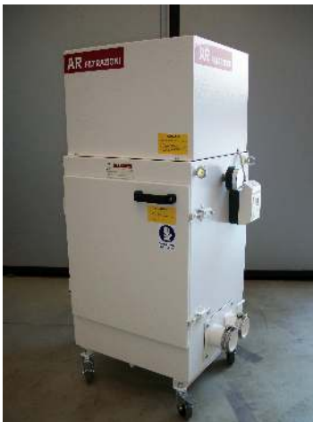
ARF700 – ARF700 FA ARF900 – ARF900 FA

The models of ARF 900 series, are equipped with low power consumption motor IE2 class .