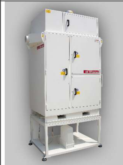
COALFILTER 4C56 con SUPPORTO COALFILTER 4C56 with SUPPORT

A drainage allows the recovery of re-condensed coolant liquid.