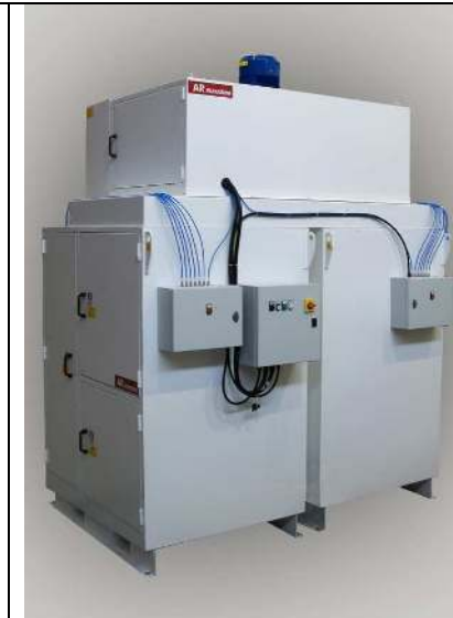
COALFILTER 8C56 COALFILTER 8C56