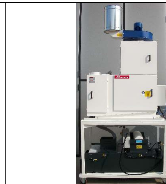
SERIE HYDROFILTER CON SILENZIATORE E VASCA HYDROFILTER SERIES WITH NOISE ATTENUATOR AND TANK