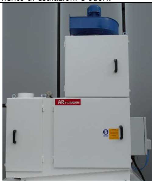
SERIE HYDROFILTER HYDROFILTER SERIES

If necessary, the HYDROFILTER Series can be provided with a noise attenuator and a carbon cell for the decrease of exhalation and odor